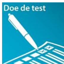
Leer jezelf kennen in het testcentrum