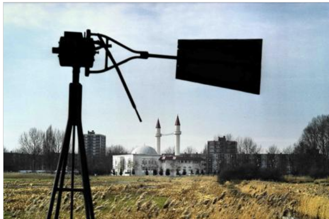
De Sultan Ahmed Moskee

Door Bob Witman op 03 december '09, 18:46, bijgewerkt 04 december '09, 12:10