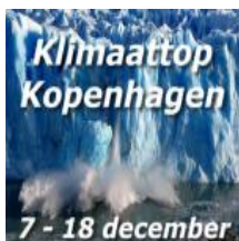
Special over het klimaat

Luxe in Prinsenland, Rotterdam Nu te huur, schrijf u direct in! www.vesteda.com/Parktoren