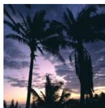
De mooiste plek ter wereld: stuur uw foto!